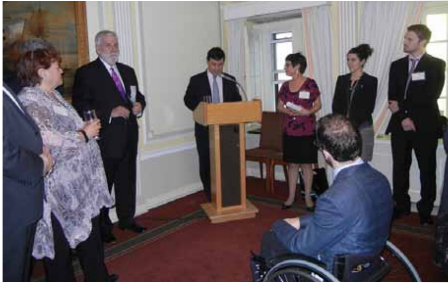
Réception au Parlement organisée conjointement par le CNFS et l'AUFC et parrainée par l'honorable Michael Chong, député d'Oshawa et président du Comité permanent des langues officielles de la Chambre des communes, le 27 mars 2012.

Le Secrétariat national a assuré la coordination de l'ensemble des initiatives de formation et de recherche du CNFS et de nombreux autres dossiers d'envergure nationale. Il a resserré ses liens avec les 11 institutions membres et les six partenaires régionaux et a pris des mesures pour harmoniser davantage les façons de faire en formation, en recherche et en communication afin de tirer pleinement profit des synergies et de l'efficacité qui en découlent. Au cours de l'année 2011-2012, le CNFS a maintenu son soutien et sa coordination de la Commission conjointe de recherche sur la santé des francophones en situation minoritaire et de la Commission conjointe sur les Ressources humaines. Le Secrétariat national a maintenu la coordination du Comité des coordonnateurs et coordonnatrices du CNFS de façon à assurer la circulation et le partage de l'information. Il a favorisé la concertation des activités et la complémentarité et la cohésion des efforts. Il coordonne la planification stratégique, assure la reddition des comptes et réalise l'ensemble des tâches requises pour soutenir le leadership et assurer la saine gouvernance du CNFS.