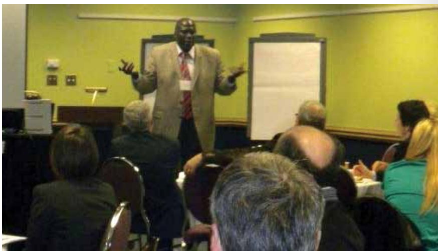
Séance de consultation pour améliorer l'intégration et le maintien en poste des PFSFE, Ottawa, le 20 mars 2012