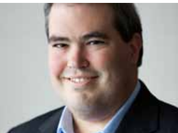
Dominic Giroux Recteur, Université Laurentienne

Nous sommes fiers de constater l'augmentation de la formation et de la recherche en français du CNFS en 2011-2012 qui a contribué à l'amélioration des soins de santé en français. Les 1 040 nouvelles inscriptions, les 596 nouveaux diplômés en santé, les 1 835 professionnels de la santé qui ont bénéficié d'une formation continue et le lancement de quelques 47 projets de recherche ont contribué à alimenter en 2011-2012 les systèmes de santé, en savoir sur la santé des francophones et en ressources humaines à l'échelle du pays. De plus, l'apport du CNFS déborde les simples chiffres de son rendement. Le présent rapport confirme les effets novateurs, mobilisateurs et rassembleurs de l'action du CNFS par l'entremise du tissage de nouveaux liens organisationnels et par la mise en place de nouvelles initiatives dans plusieurs sous-secteurs de la formation et de la recherche en santé.