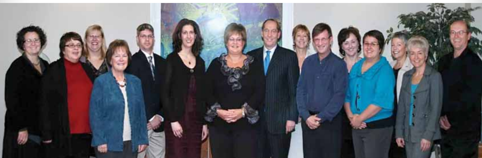
Lancement du livre « Vivre sa santé en français au N.-B. : le parcours engagé des communautés acadiennes et francophones dans le domaine de la santé », Moncton, le 22 novembre 2011.

L'Université de Moncton négocie sur plusieurs paliers avec les deux régies régionales de la santé (Vitalité et Horizon) pour développer des ententes de formation clinique dans divers secteurs de la santé, y compris en psychologie. Elle a offert un atelier avancé, en partenariat avec l'Université d'Ottawa, à 27 coordonnatrices et superviseurs de stages du Nouveau-Brunswick de diverses disciplines (nutrition, psychologie, travail social, gestion des services de santé et science infirmière). Elle a mis en place une stratégie de rencontres régulières de suivis réunissant ses coordonnateurs de stages en nutrition, travail social et psychologie avec les superviseurs de stages de ces disciplines dans les établissements de santé pour resserrer les liens de communication et la collaboration, et pour les intégrer à la révision des approches et outils de formation clinique.